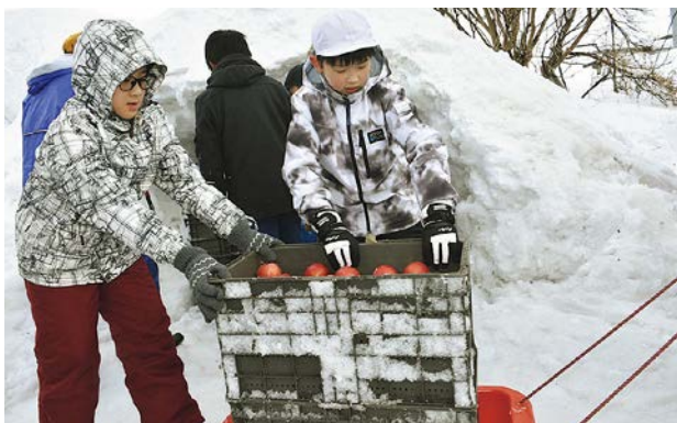
雪室からリンゴを取り出した児童たち