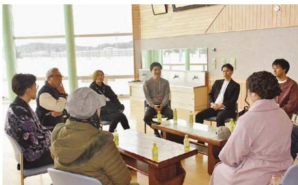
入居者との交流会で談笑する参加者