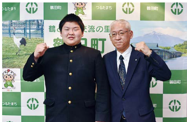
これからの活躍を誓った神さん(左)