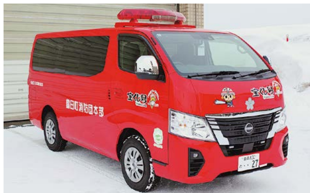
今回交付された災害活動車両

今回交付された車両は四輪駆動で10人が乗車できる輸送力をほこり、災害時には緊急車両として人員や資機材の搬送に活躍が期待されます。また、防災学習資機材は平時に、地域住民向けの防災指導などに活用されます。