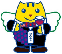
スチューベンめいすいくん （ご当地めいすいくん）

鶴田町大字鶴田字早瀬 200-1 TEL：0173-22-2111（内線 101／227）