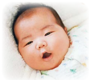
つつみ 鼓珠ちゃんへ