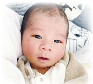
とうま 翔真ちゃんへ