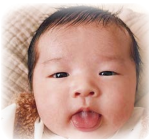
ほうのすけ 宝乃助ちゃんへ