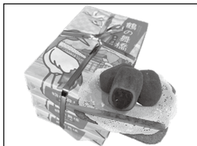
▲8月号クイズ景品「鶴の舞橋三連餅」