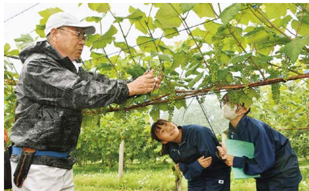
ぶどう農家から「房作り」を教わる生徒たち

ぶどう園を訪れた生徒たちは生産者の指導を受けながら、ぶどうの房の大きさを整える「房作り」を体験。生徒たちは適切なぶどうの大きさの目安となる、縦12cm、横5cmに切った紙をぶどうに当てながら、紙からはみ出す余分な実をハサミで切り取っていました。また、生徒たちは生産者へスチューベンについて質問し、スチューベンへの理解を深めていました。