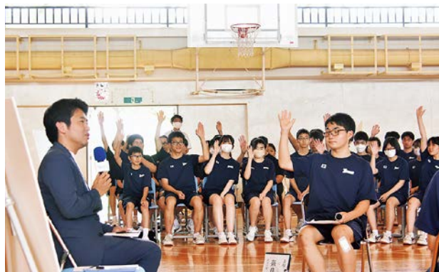
宮下知事と対話する中学生たち

集会の最後に宮下知事は「答えのわからない課題に直面するかもしれないが、対話をすることで納得解を得られるので皆さんには対話を大切にしてもらいたい」と話していました。