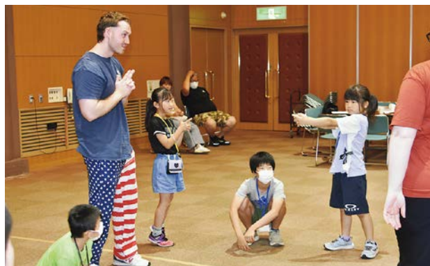
英語を使ったゲームを楽しむ子どもたち

町国際交流会館で行われたイベントには、町内の小学生約40人が参加しました。今回は町内外の国際交流員や外国語指導助手ら5人が講師となり、ゲームのルールを紹介。子どもたちは普段の学校の授業で体験できない英語を使ったゲームや外国人講師との交流を通して、英語への興味や関心を高めていました。