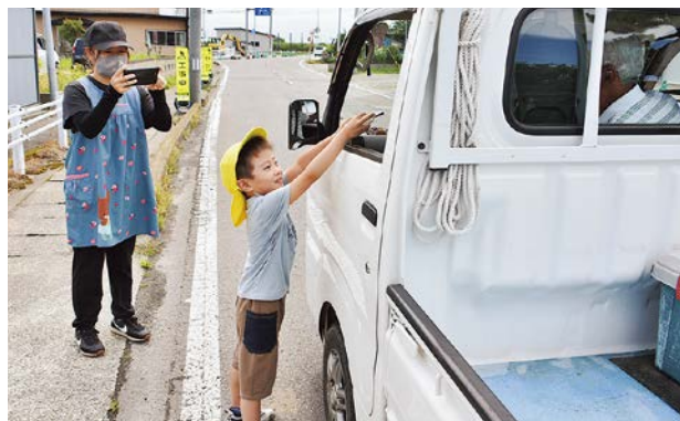
ドライバーに安全運転をお願いする子ども

活動は鶴田交番の警察官立ち会いのもと行われ、子どもたちが自動車のドライバーに「安全運転をお願いします」と声がけをし、反射材や交通安全のお守りなどを手渡していました。手渡した反射材などには「安全運転」と子どもたちが書いた手紙も添えられていました。