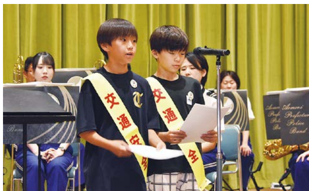
誓いのことばを述べる小学生たち