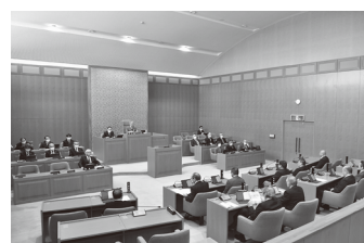
△3月に始動した新たな町議会

今後は継続して「広報つるた」内に議会活動報告をさせていただきますので、町民の皆さまもご注目ください。