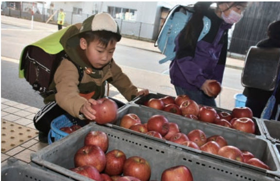
家から持ってきたリンゴを丁寧に移し替える子どもたち