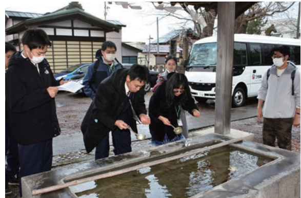
参拝の作法を商業生から教わる留学生（中央右）

モニターツアー後には、留学生から「スチューベンを『日本一』と説明する際に、数値などがあつた方が根拠があつて外国人は納得するかも」などのアドバイスを生徒たちに送っていました。