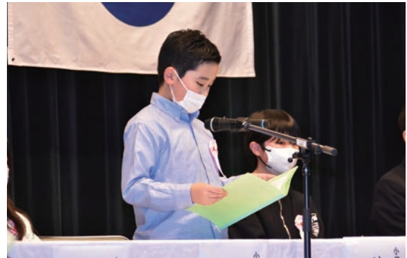
最優秀賞に輝いた作文を発表する子どもたち

大会では、地域の社会福祉活動に貢献した個人99、15団体を表彰されたほか、町の児童や生徒が日頃、福祉について感じたことや考えていることを書いた福祉作文コンクールの表彰式も行われ、最優秀賞に輝いた受賞者が作文を発表していました。