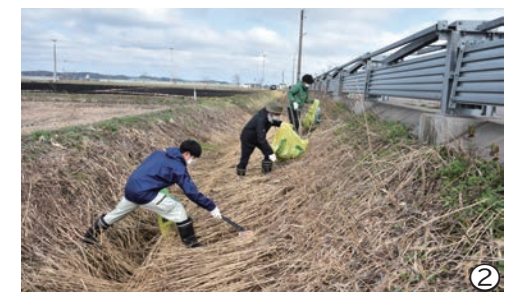
①役場周辺や駅前を清掃するボランティアの方々 ②農免道路の沿道を清掃するボランティアの方々 ③農免道路の沿道に捨てられたゴミ ④この日回収された粗大ゴミ