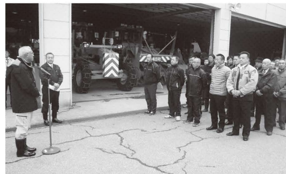
△除雪結団式では町長が作業員（右）を激励