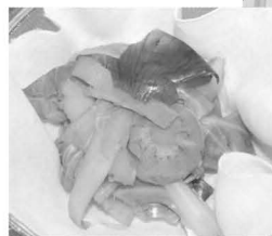
◁ベジブロス（野菜だし）