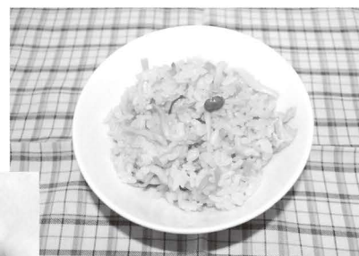
△うまみたっぷり炊き込みごはん