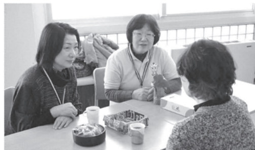
△あなたの気持ちに寄り添ってお話を聴きます。