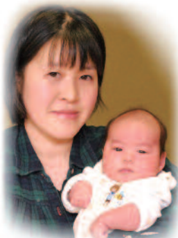
幸村（ゆきむら）ちゃんへ