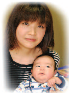
有翔（あると）ちゃんへ