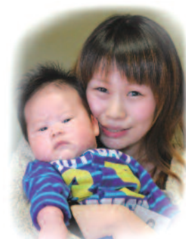
暁次（きょうじ）ちゃんへ