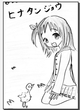
ペンネームゆきさん(田の尻)