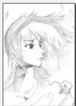
ペンネームP・Nクロレラさん(倉浦川)