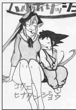
ペンネーム初音ミクさん(みどり町)