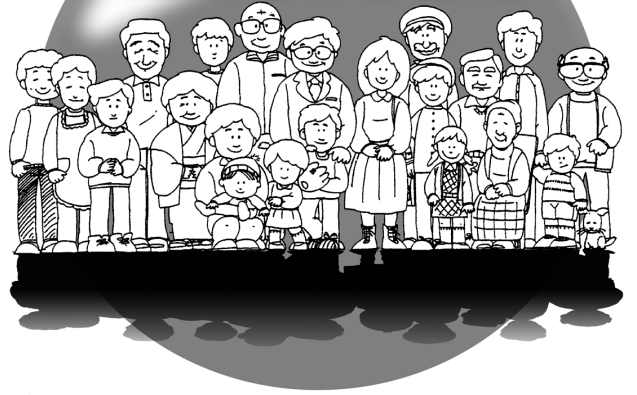
◁有里子(ゆりこ)ちゃんへ