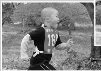
顔も頭も輝いています! 元気印大賞