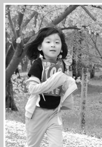
わたしの走るスタイルよ!