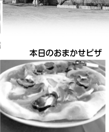
本日のおまかせピザ