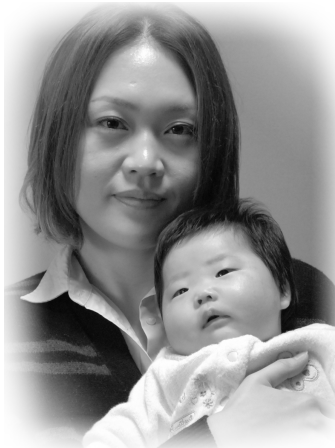
▽陽彩(ひいろ)ちゃんへ