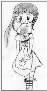
・バンナムかわいいもみじさん(廻堰)