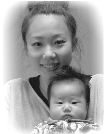
▽絆音(きん)ちゃんへ

日々の成長が嬉しいです。明るく元 気な子に育ってね。生まれてきてく れてありがとう。