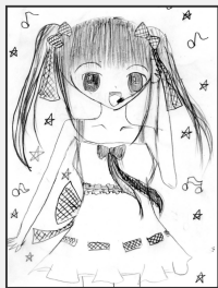
・バンナムぞつすいさん(廻堰)