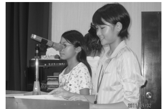
・合宿後半は塾生自ら司会も