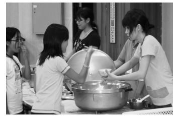
・朝食で給仕する大学生