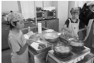
・調理風景/男子も当然調理します

理の仕方、野菜の選び方、洗濯の仕方、掃除の仕方などです。調理では仲間や友だちの協力があったからこそおいしく上手に作れたと思います。にぎりまんま塾を通して、お父さんとお母さんの大変さが分かりました。この経験を今後の生活に生かしていきたいと思います。