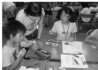
・大学生が何でも指導してくれました

この合宿に昨年も参加しました。今年の合宿も苦労の連続で、母やおばあさんの苦労が身にしみてよく分かりました。わたしは将来、今回指導してくださった大学生のようなボランティア活動に参加したいと思っています。忘れられない5日間、ありがとうございました。