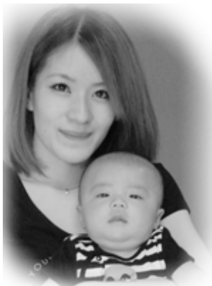
▽ 飛雅 (ひゆが) ちゃんへ