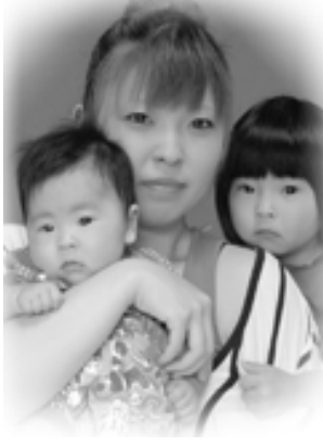
▽ 珠莉 (じゅり) ちゃんへ