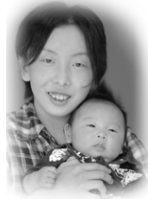
▽ 理央 (りお) ちゃんへ