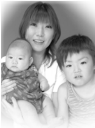
▽ 慧士 (けいじ) ちゃんへ