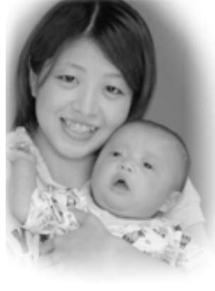
▽ 逢人 (あいと) ちゃんへ