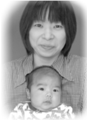
▽ 悠翔 (はると) ちゃんへ