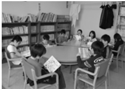
△児童図書は2階ふれあい室にあります