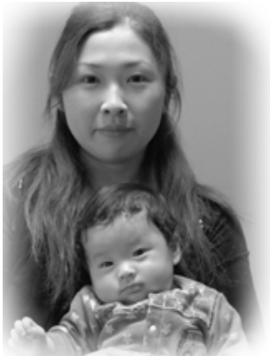
△ 礼煌 (らいき) ちゃんへ