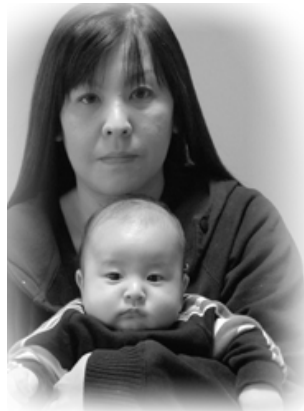
△ 翔琉 (かける) ちゃんへ