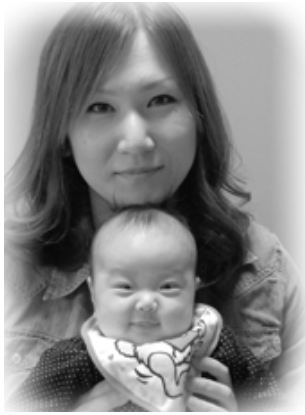
△ 聖和 (せな) ちゃんへ