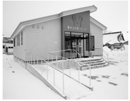
・野木ふれあいセンターの外観

「野木ふれあいセンター」が完成しました 野木文化センターの老朽化にもない、野木ふれあいセンターが建設され、この3月に完成しました。 このセンターは、(財)むつ小川原地域・産業振興財団の原子燃料サイクル事業推進特別対策事業および財団法人自治総合センターのコミュニティ助成事業の助成を受けて建設されました。