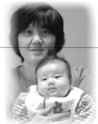
▽幸之助 (ゆきのすけ) ちゃんへ