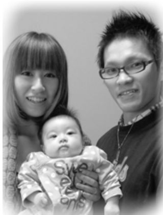
▽栗 (あ) ちゃんへ