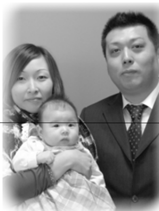
▽萌楓 (もか) ちゃんへ