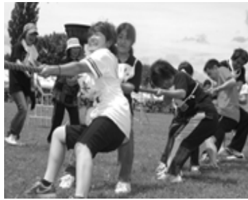
▲綱引きで盛り上がる町内会チーム(昨年度)

来る、7月25日(日)、「第41回町民ふれあいスポーツフェスティバル」が鶴田中学校グラウンドで開催されます。今年も、趣向を凝らした楽しい競技を企画しておりますので、ぜひご家族そろってご参加ください。なお、参加につきましては、各町内会単位での参加になりますので、各町内会までお問い合わせください。