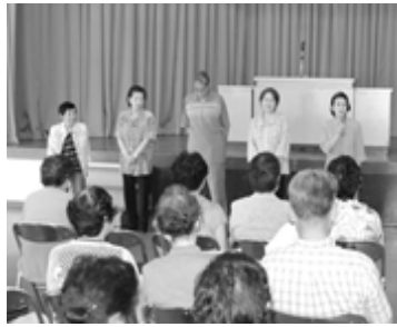
▲今年の実行委員が紹介されました

今年は一〇六人(男性21人・女性85人)の参加者のもと、「いきいき健康体操」や「体力テスト」など、11月まで全8回にわたり講座が開催されます。また、申込みされていない方でも受講が可能です。