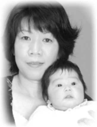
▽ 愛理 (あいり) ちゃんへ