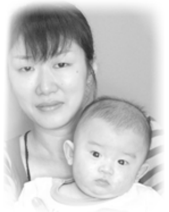
▽ 来都 (らいと) ちゃんへ