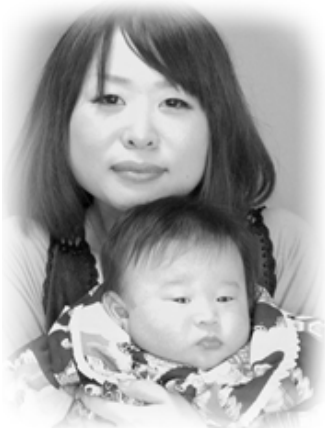
▽ 鴻 (ひろ) ちゃんへ