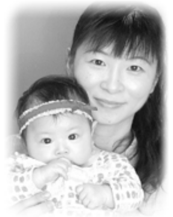
▽ 海樺 (うみか) ちゃんへ