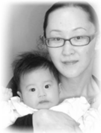
▽ 琉衣 (るい) ちゃんへ