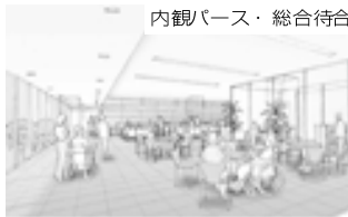
内観パース・総合待合

なお、詳しい基本設計の概要につきましては、つがる西北五広域連合ホームページで公表しております。