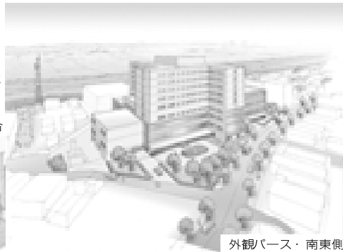
外観パース・南東側

中核病院の基本設計については、全国公募型プロポーザルにより設計業者を決定し、設計計画を進めてきたところですが、このたび基本設計が完成し、建物の概要がまとまりましたのでその一部をご紹介します。