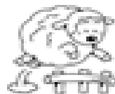
羊がたくさんいます（人口の約9倍）