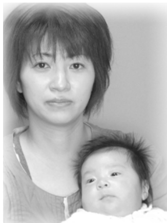
▽恵大(けいた)ちゃんへ