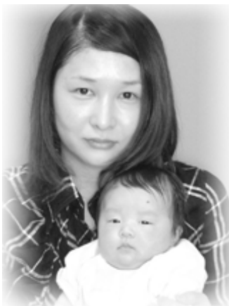
▽つばひなちゃんへ