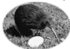
ニュージーランドの国鳥 キーウイ