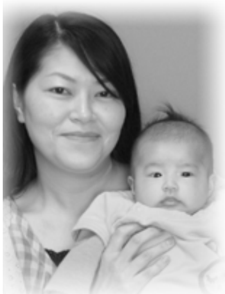
▽愛加(あいか)ちゃんへ