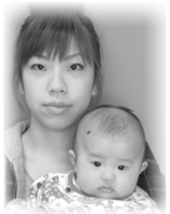
▽乃愛(のあ)ちゃんへ