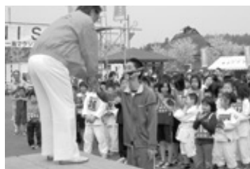
町長さん、いつもお世話になってます!

元気印しゃしんかん つるたの元気な子どもたちの活動を写真で紹介 します。今回は、「第12回富士見湖一周マラソン 大会」からピックアップしてみました。