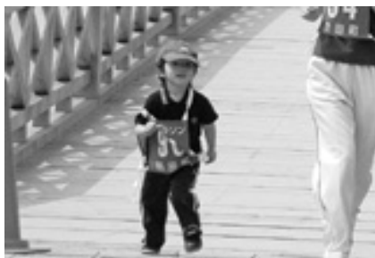
少し小さいゼッケン欲しかったなあ～