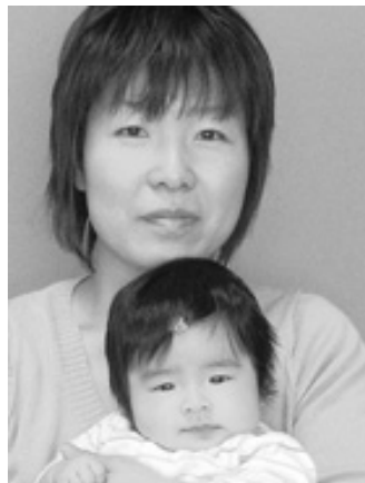
◁ 桢乃(のの)ちゃんへ