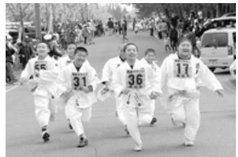
柔道少年はマラソンが得意! んっ、でも後には誰も…