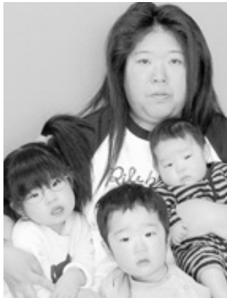
◁ 寿樹(としき)ちゃんへ