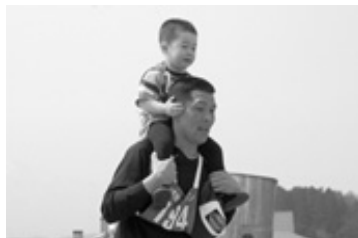
父ちゃんの目をゴシゴシすると前に進む