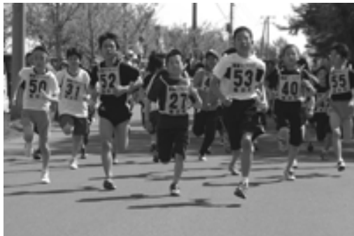
△昨年の大会の様様・小学生男子

所定の申込用紙に必要事項を記入し、参加料を添えて直接事務局へお申し込みください。(申込用紙は教育委員会にあります) 教育委員会 社会教育班内 「津軽富士見湖一周マラソン大会事務局」まで TEL (22) 2111 (内線212)