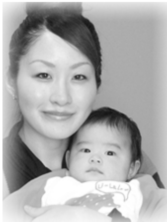
△愛桜(めいさ)ちゃんへ