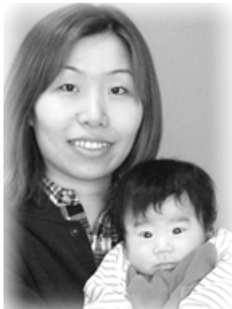
△沙来(さら)ちゃんへ