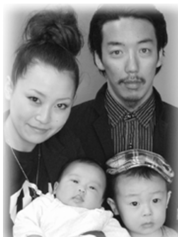
△誉(ほまれ)ちゃんへ