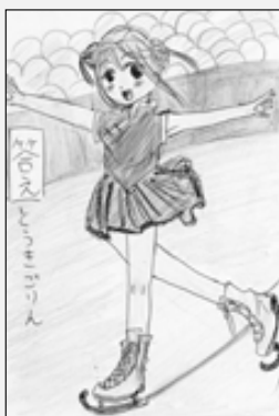
ペンネーム銀魂さん(廻堰)