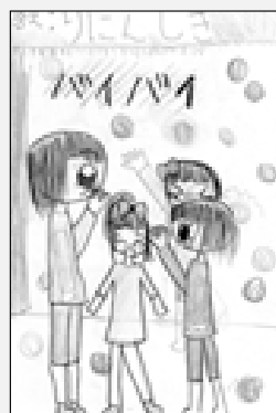
ペンネームおかゆさん(廻堰)