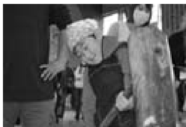
おいら、ちびっ子パワーさくれつだ

元気印しゃしんかん 元気がつるたの子どもたちを活動とともに写真で紹介!今回は、「梅沢小学校防犯もちつき大会」からピックアップしてみました。