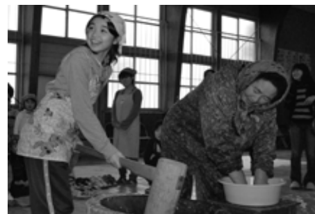
うまくつけたよ、みんな取りにきて来て