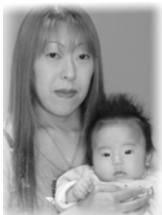
△心都(こんと)ちゃんへ