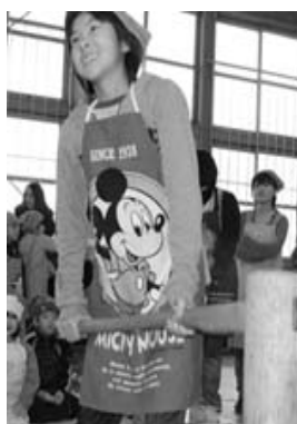
くっついて上がんなあ〜い