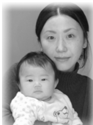
△紬(ひびき)ちゃんへ