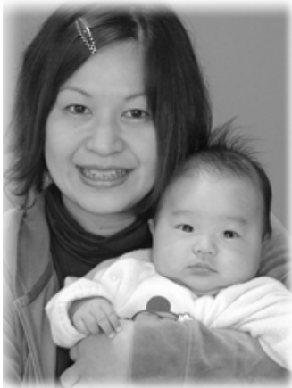
◁暖大(はるた)ちゃんへ