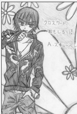
ペンネームスマイルさん(大巻)