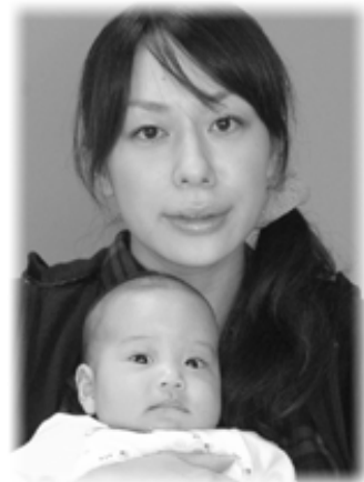
◁侑恩(れお)ちゃんへ