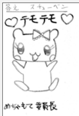
ペンネームしゅごキャラさん(みどり町)