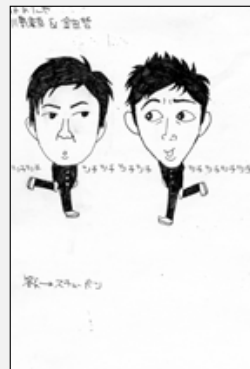
ペンネームしゅごキャラさん(みどり町)