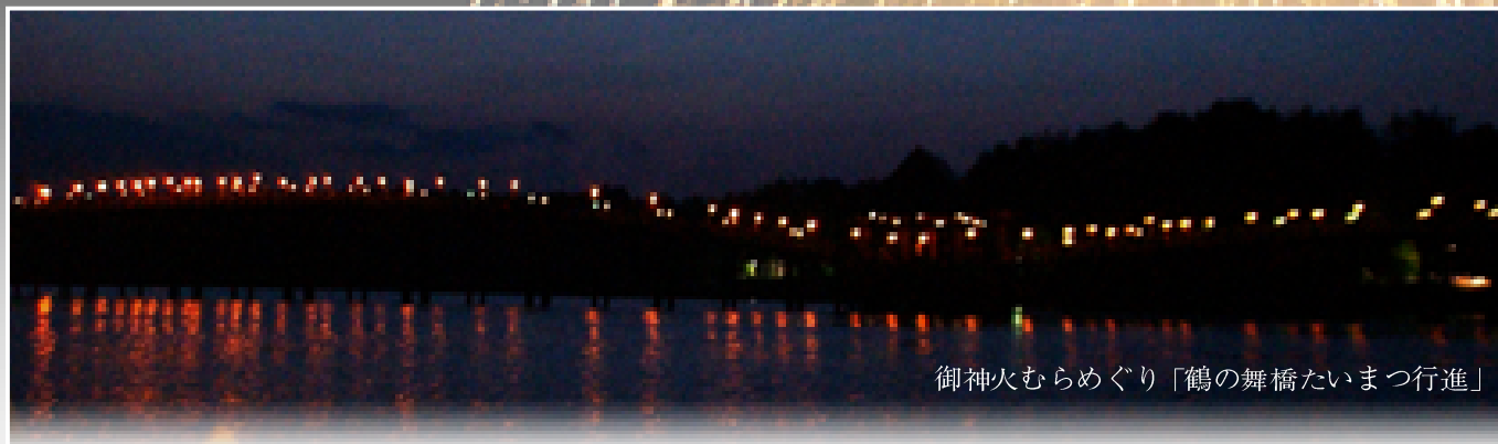
御神火むらめぐり「鶴の舞橋たいまつ行進」

まつり 最終日、津軽富士見湖で行われた花火大会は、約7万6千人の人出でにぎわい、観客たちは湖面に輝く黄金の龍神船（ねぶた）や水上花火、上空の花火から映し出される鶴の舞橋などといった鶴田ならではの優美な花火に大きな歓声が上がっていました。