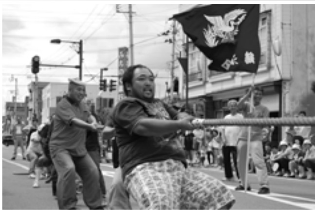
△綱引きグランドチャンピオン決勝戦・町民ふれあいスポーツフェスティバルでブロック優勝した4チームによる決勝戦。昨年に引き続き鶴泊チームが優勝し連覇しました。準優勝は菖蒲川チーム