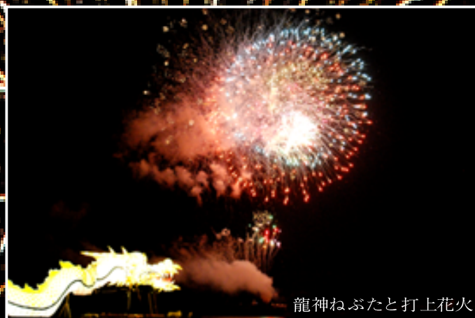
龍神ねぶたと打上花火