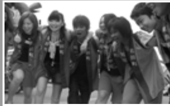
△選行の前に気合いを入れる子どもたち