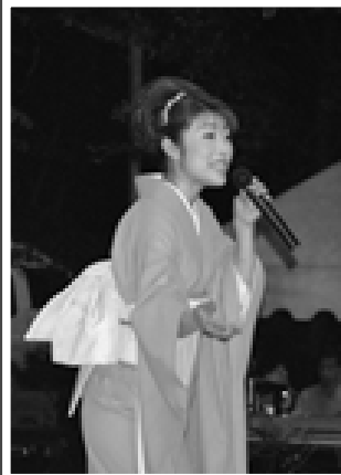
△艶やかな「華かほり歌謡ショー」