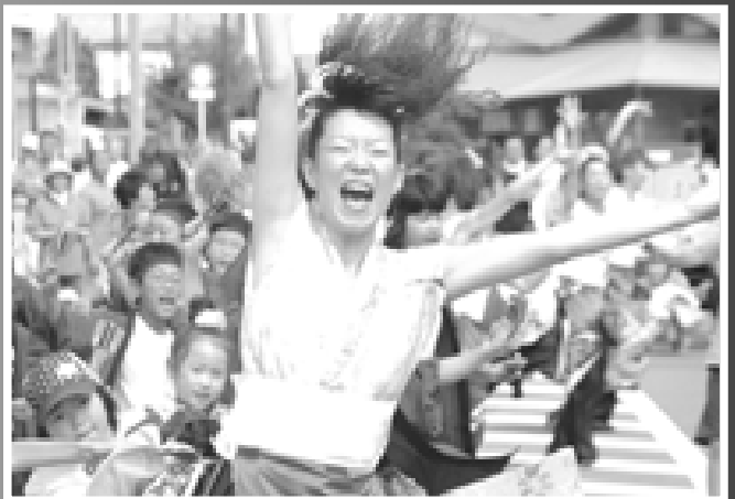
△花嵐桜組スペシャルYOSAKOIソーランでは子どもたちと共演