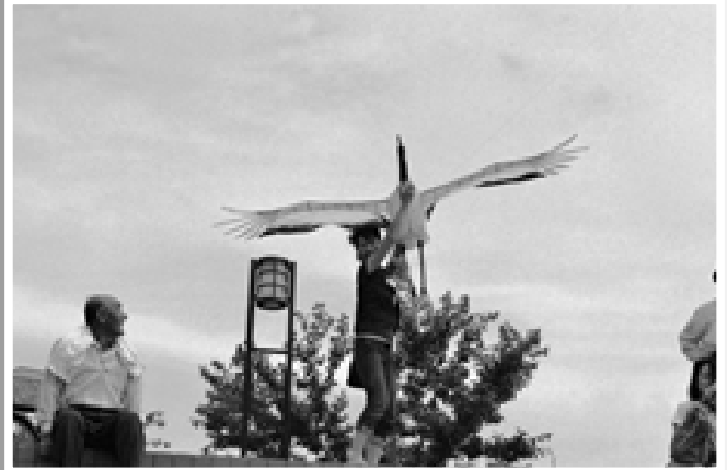
△午後2時から鶴寿公園で大会を開催（岩木川河川敷にて）