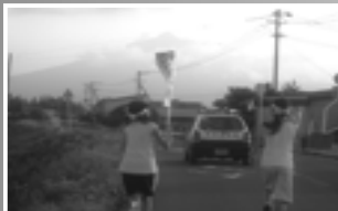
△火おこし神事と御神火むらめくり

8月16日(金) 御神火むらめくり・龍神ねぶた湖上運行・花火大会へ 最終日、町の子どもたちによる「御神火むらめくり」が行われました。各神社からいただいた御神火を子どもたちがリレーで鶴田八幡宮まで運び、鶴田八幡宮では火おこし神事が行われ、その後、子どもたちによる富士見湖（間山地区）までの御神火リレーが行われました。