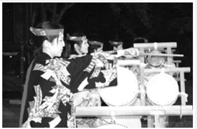
△鶴田町太鼓の会「五ツ太鼓」・前列、女4人衆そろい踏み