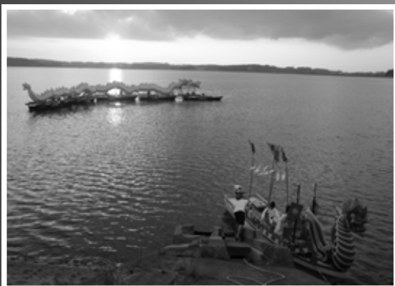
△御神火は間山地区から巫女舟にのって花火大会会場へ