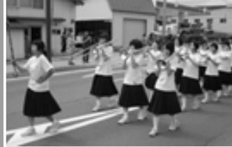
△鶴中プラスバンド演奏行進