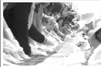
△龍巻寿司・参加者が一斉に海苔を敷く