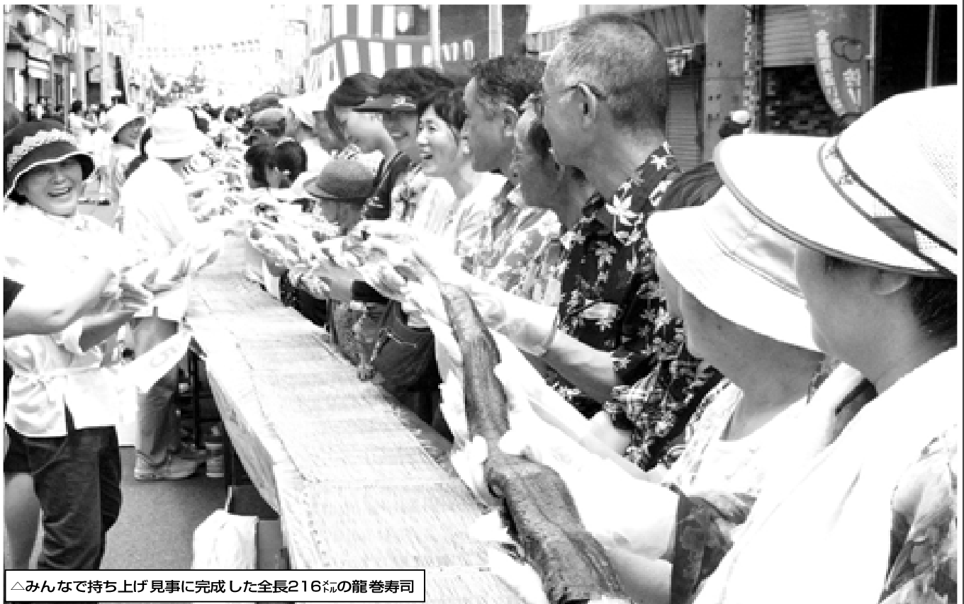
△みんなで持ち上げ見事に完成した全長216mの龍巻寿司