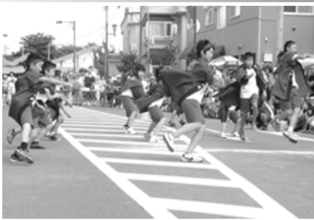
△鶴田小学校児童による元気なYOSAKOIソーラン

8月14日(金) 龍巻寿司 綱引きグランドチャンピオン決勝戦 YOSAKOIソーラン 恒例の龍巻寿司では、本町通りに800人の観客が訪れ全長216mの太巻き作りに挑戦、全員で息をあわせ今年も見事に完成しました。