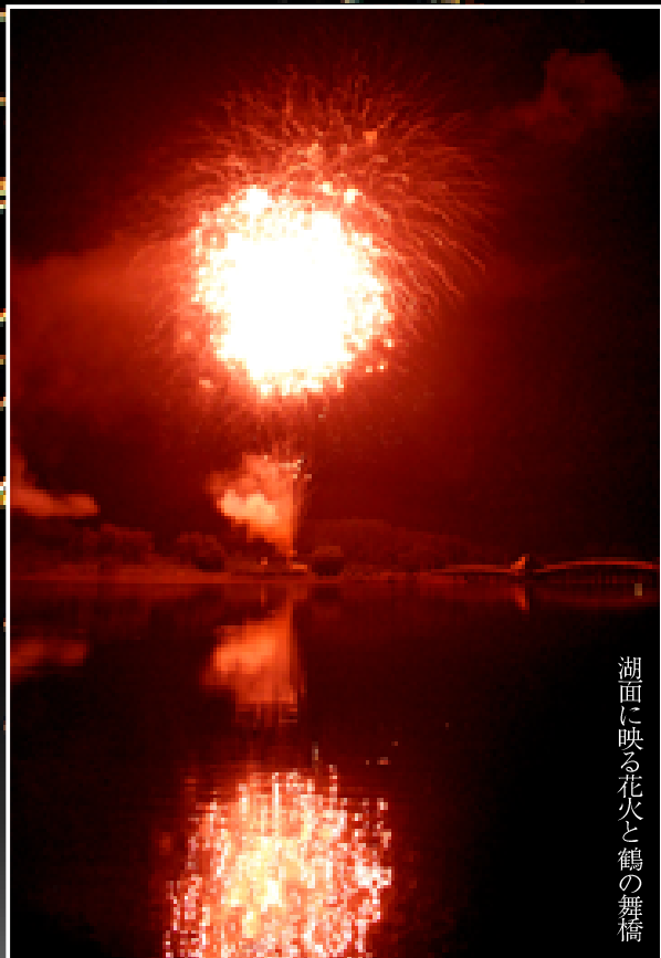
湖面に映る花火と鶴の舞橋