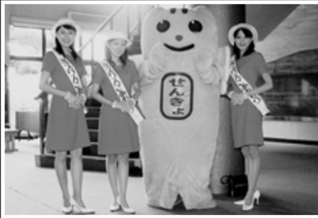
△パレードを飾ったミスりんごおもりの3人と「めいすいくん」

2日目の夕方からは、鶴寿公園でイベントが行われ、訪れた700人の観客がさまざまな公演を楽しみました。