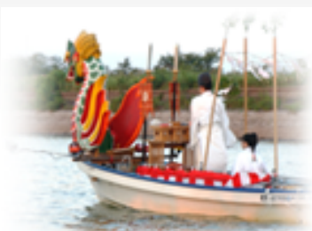
～御神火を運ぶ「巫女舟」～

「2009つるたま祭り」のイベントにご協力いただきました企業・団体および町民の皆さまに対し心からのお礼と感謝を申し上げます。ありがとうございました。