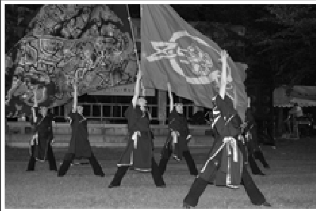
△YOSAKOIソーラン／よさこい・零ZERO