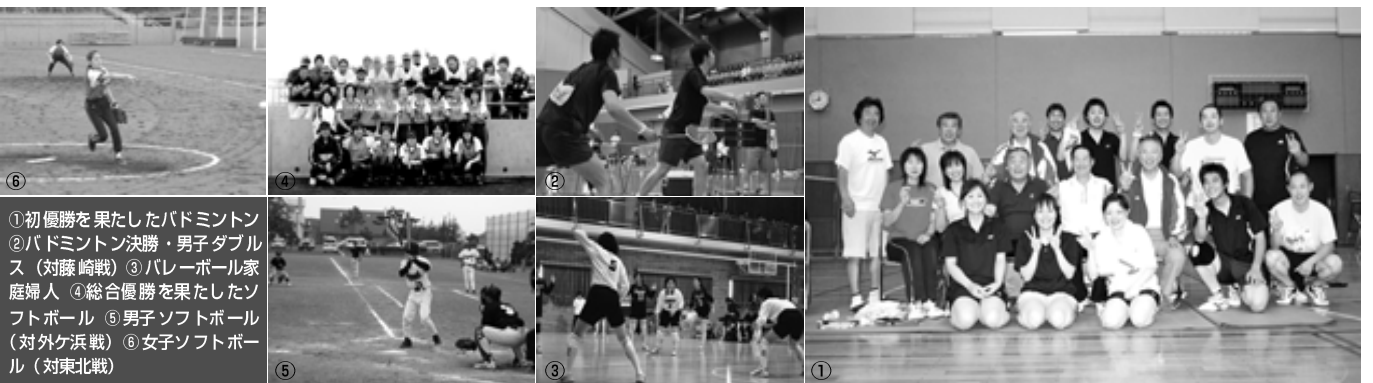
①初優勝を果たしたバドミントン ②バドミントン決勝・男子ダブルス(対藤崎戦) ③バレーボール家庭婦人 ④総合優勝を果たしたソフトボール ⑤男子ソフトボール(対外ヶ浜戦) ⑥女子ソフトボール(対東北戦)