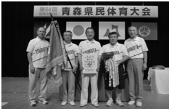
△皆さまからのさくさんのご声援ありがとうございました。

8月1日(土)・2日(日)・8日(土)・9日(日)の4日間 にわたり、第64回市町村対抗青森県民体育大会が二沢市を主会場に開催され、わが町は、バドミントン、ソフトボール、軟式野球、バスケットボールの4競技で優勝し、陸上、柔道、重量挙げは準優勝に、またそのほかの競技でも安定した成績をあげ、2位以下に大差を付けて、町村の部4年連続15回目の栄冠に輝きました。