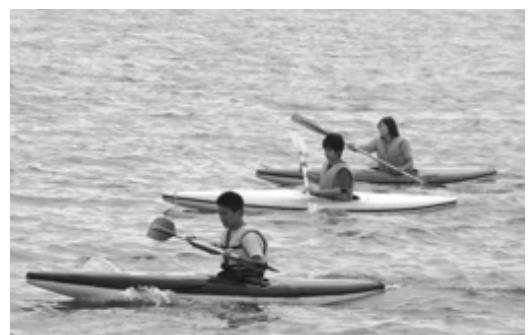
△カヌー競技は、腕力、体力、そしてバランスが大切