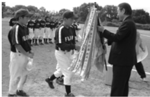
△歴史ある優勝旗が中野町長の手から富士見小に渡される

8月2日(日)～3日(月)、鶴田町営野球場において、北五地区から12チームの参加のもと、「鶴寿橋開通記念 第32回学童選抜野球大会」が開催されました。今大会は激戦が予想されましたが、走攻守揃った富士見小学校が混戦を制し、15年ぶり3回目の優勝を手に入れました。試合結果は次のとおり。