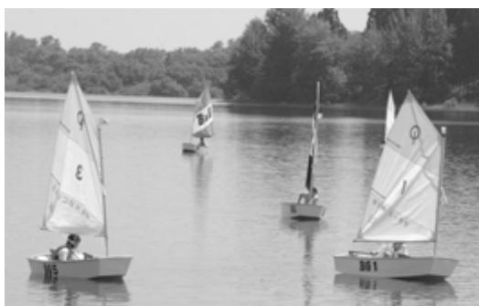
△無風の中じっと風を待つ選手たち・OPヨットレース