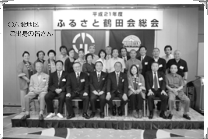
○六郷地区 ご出身の皆さん