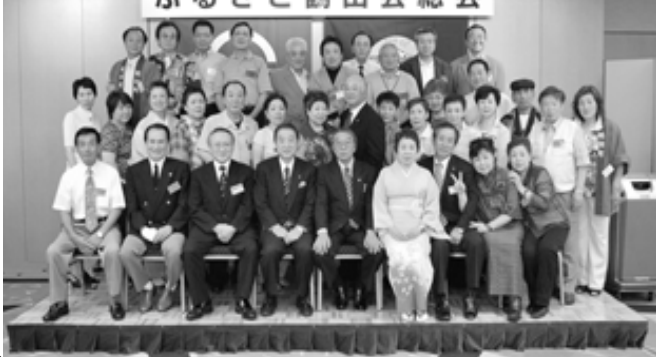
○水元地区 ご出身の皆さん