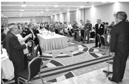
△乾杯の首領をする出町議長

このほか、会場内には「鶴田町特産品コーナー」「鶴の里あるじゃコーナー」が設置され、懐かしいうんぺいや漬物などのふるさとの味、町の特産品であるスチューベン・リングを使用した加工品の数々が販売され、会員の皆さまには大変好評でした。