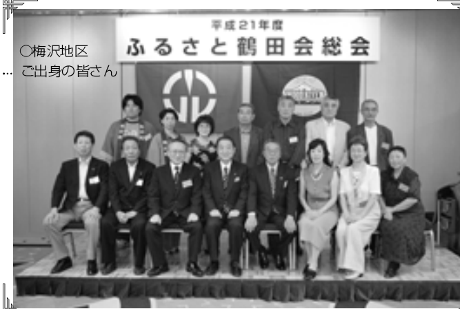
○梅沢地区 ご出身の皆さん

やカラオケ、抽選会などを楽しみ、会場の中央では、盆踊りの「ドダレバチ」を踊り、最後は全員で「ふるさと」を合唱して今年のふるさと鶴田会が締めくくられました。