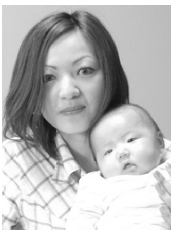
▽愛桜(まお)ちゃんへ