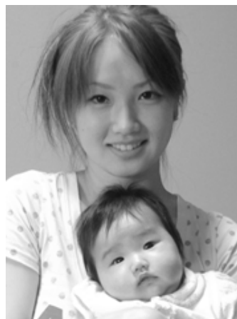
▽麗華(れいか)ちゃんへ