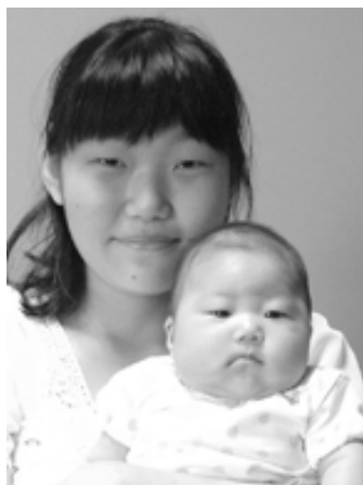
▽磨和(まわ)ちゃんへ