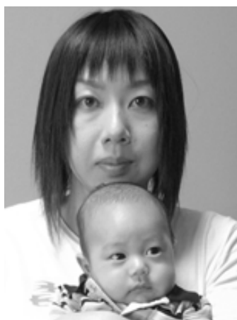
▽央羅(おうら)ちゃんへ