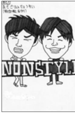
ペンネームステイツチさん（みどり町）