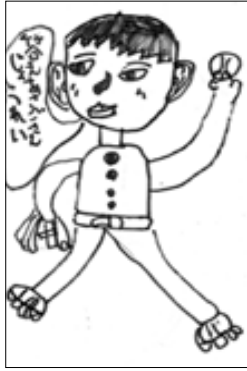
ペンネーム野球少年さん（木筒）