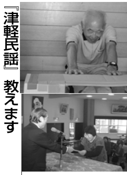
△昨年の様様。上は体力測定、下は修了式

受講者の実費負担となります。 ◆問い合わせ先 教育委員会社会教育班 (内線212)