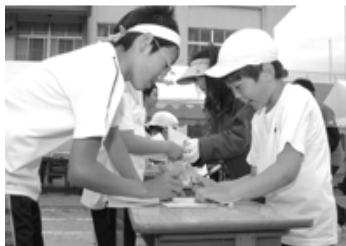
あれれ問題が解けない(胡桃館小)