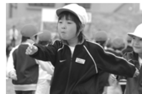
行進はお手のものです(鶴田小)