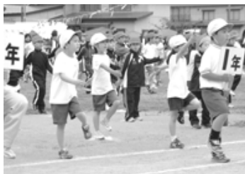
ちょっとバラバラだけどゆるして(鶴小)

町の元気な子どもたちを写真で紹介します。今日は、各小学校で行われた「大運動会」の子どもたちです。