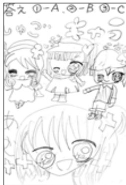
ペンネームクロバーさん (木筒)