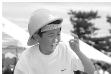
これダム工事より難しい!? (胡桃館)