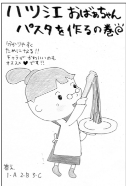
ペンネームチューリップさん (妙堂崎)

応募方法 ハガキに答え、住所、氏名（未成年の方は保護者名も記入）、年齢と広報に対するご意見やご要望などを書き添えてください。イラストなども大歓迎です。正解者の中から、抽選で5人の方に、道の駅つるた・鶴の里あるじゃ提供「オリジナル米粉パン引換券」をプレゼントします（月末必着）。