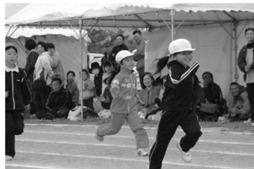
わたし速いでしょ、まってえー(富士見小)