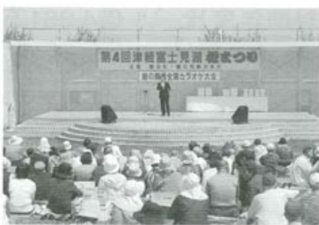
△カラオケ大会の様様。