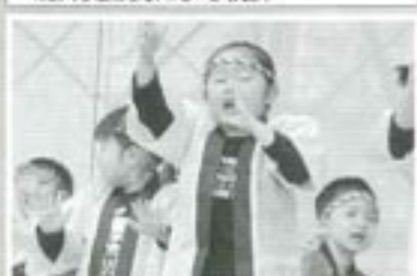
△園児たちによる演技(はやせ保育園)