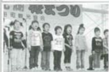
△園児たちによる「開会のことば」