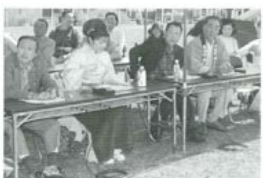
△レベルの高さに驚か審査員の皆さん。