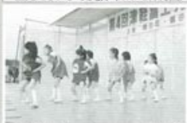
△朝ごはん運動の踊り(ききょう児童館)