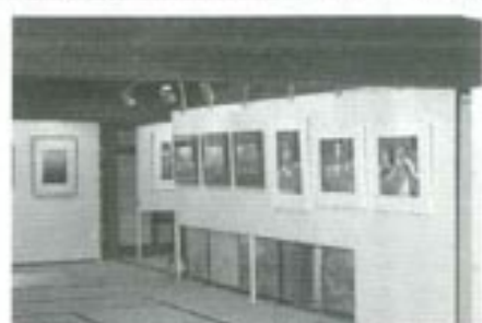
△鶴田写真クラブ写真展(鶴の里ふるさと館)