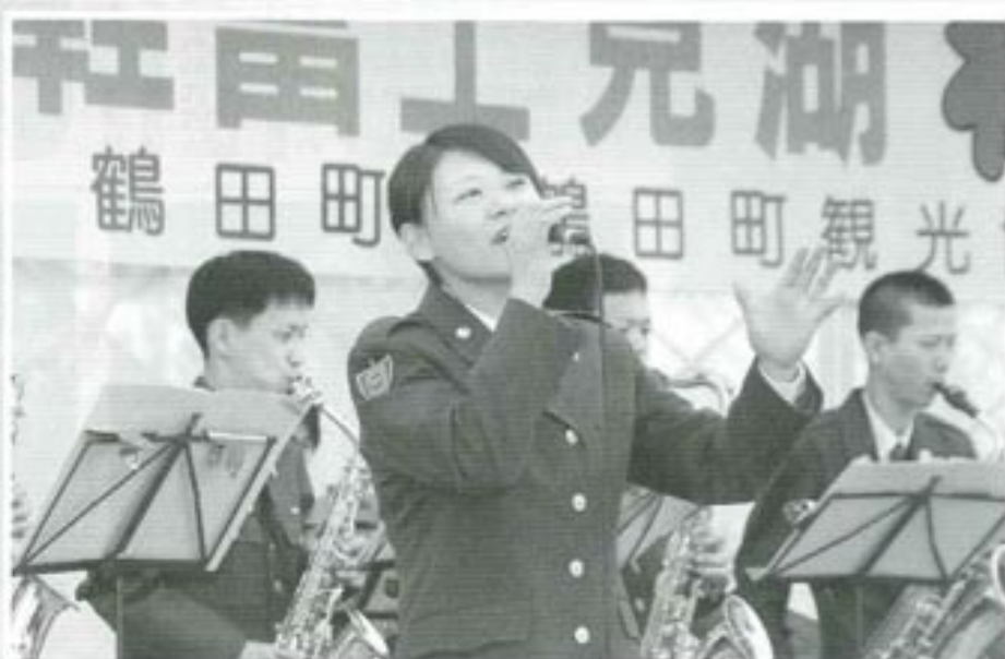
△陸上自衛隊第九音楽隊のステージ・演奏とともに女性隊員がすばらしい歌声を披露してくれました