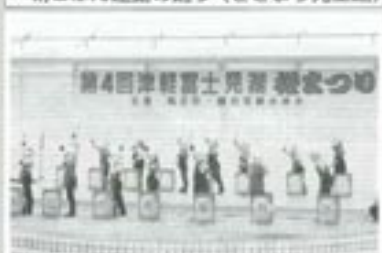
△和太鼓・立役武多(中央保育所)