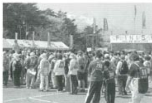
当日は快晴、雄大な岩木山をバックに行われた開会式