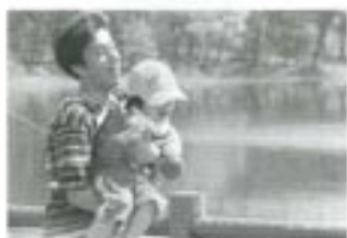
お父さん早い（ファミリーの部）