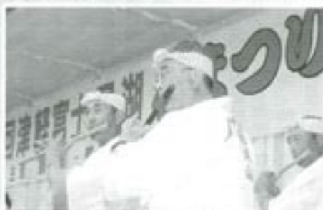
△鶴田町登山獅子保存会の皆さん