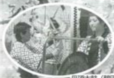
丹頂太鼓（鶴田太鼓の会）