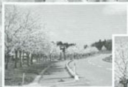
桜の鑑賞日 / 4月24日

今年で第四回を迎える「津軽富士見湖桜まつり」が、五月三日(日)～五日(火)まで、富士見湖パークを主会場に開催され、昨年を千人上回る二万人の方が来場し、桜まつりならではのさまざまなイベントに、会場は大いに盛り上がりを見せました。全ての模様をお伝えできませんが、一部を皆さんに写真でご紹介します。