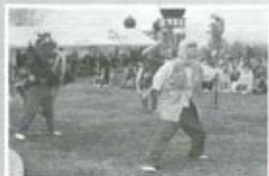
△富士見小学校獅子舞