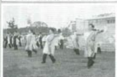
△鶴田生き生きソーランの皆さん