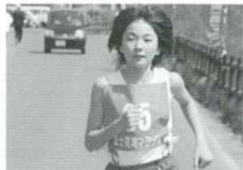
さわやかな春風をうけ、ランナーたちが駆け抜ける