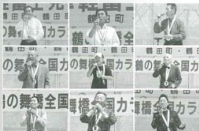
△予選会に参加された皆さん。遠方は茨城県の方もいらっしゃいました。