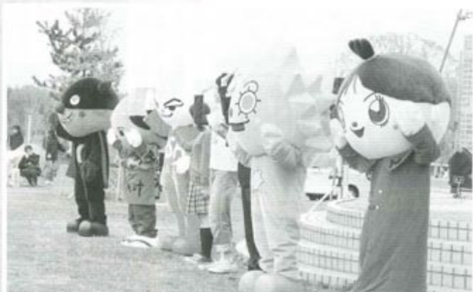
△文部科学省・早寝早起き朝ごはんキャラバン隊による「朝ごはん運動のキャラクター演劇」