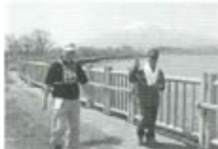
ザ・マイペース！（ウォーキング）