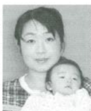
△雪乃(ゆきの)ちゃんへ