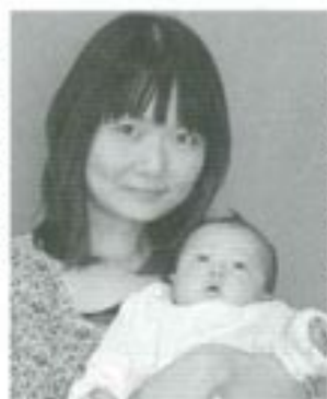
△抽歌捺(ゆかな)ちゃんへ