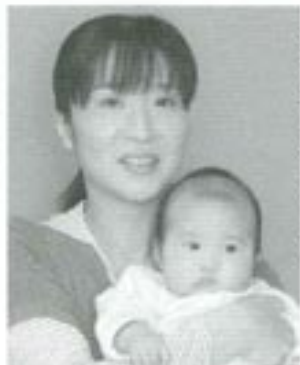
△仁恋(にこ)ちゃんへ