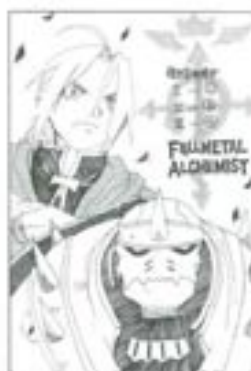
ペンネーム雪桜さん(葛蒲川)