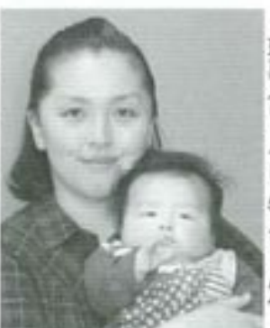
△琉真(りゅうしん)ちゃんへ