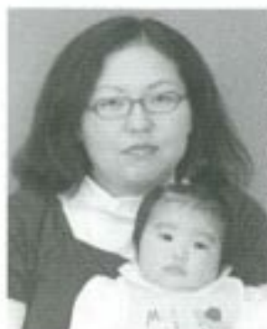
△瑞音(るのん)ちゃんへ