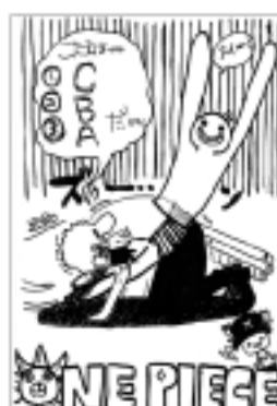
ペンネーム GGさん(文化通り)