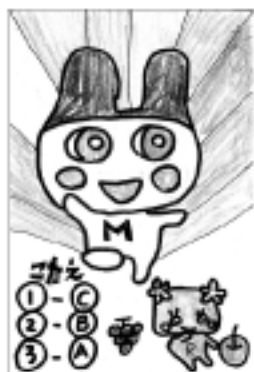
ペンネーム たまごちゃんさん(木筒)