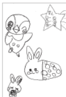
ペンネーム ももふたさん(木筒)