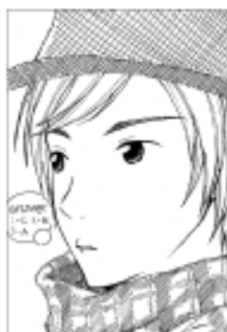
ペンネーム コスモスさん(妙堂崎)