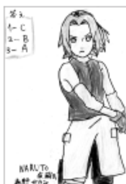
ペンネーム ゆきさん(田の尻)