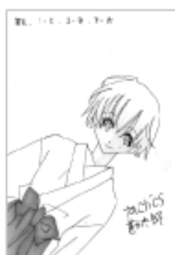
ペンネーム チューリップさん(妙堂崎)