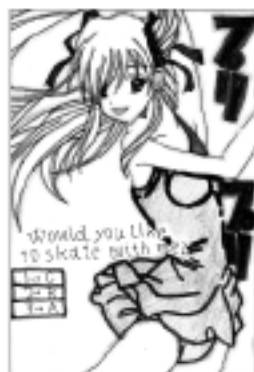
ペンネーム プリプリさん(みどり町)