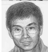
現在のイメージ画