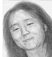
現在のイメージ画