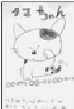
ペンネーム ミーターンさん(駅東町)