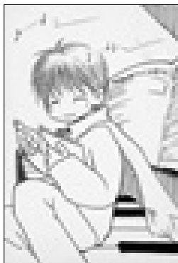
ペンネーム コスモスさん(妙堂崎)