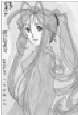
ペンネーム チューリップさん(妙堂崎)