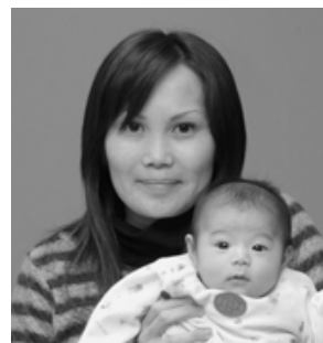
▽ 聖捺(せな)ちゃんへ