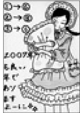
ペンネーム ラスカルさん(廻堰)