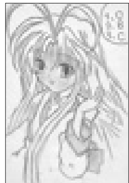
ペンネーム 新鮮組さん(みどり町)