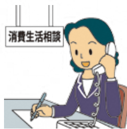
「消費者庁イラスト集より」