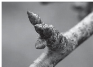
摘芽後(同:3個、大きい花芽を残す)