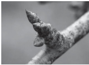
摘芽後（同・3個、大きい花芽を残す）