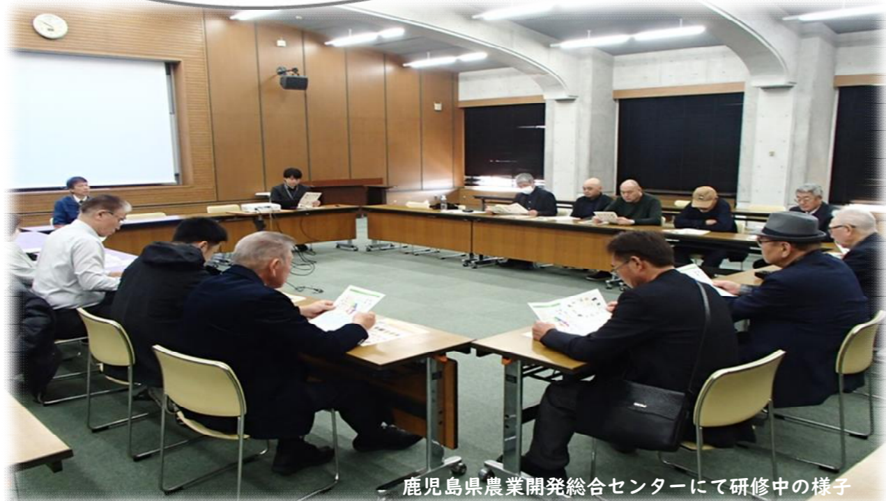
鹿児島県農業開発総合センターにて研修中の様子

《編集・発行》 鶴田町農業委員会事務局 22-2111(代表) (内線 294. 295. 296)