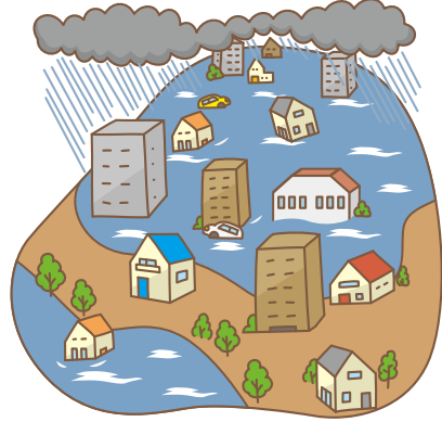
内水ハザードマップの対象水害です

河川の水を「外水」と呼ぶのに対して、市街地などの堤防で守られた土地にある水が「内水」です。側溝や水路などの排水能力を超える大雨や河川の水位が上昇することで「内水」を排水できず、側溝や水路などから水が溢れ出し、土地や道路などに浸水してしまう現象が「内水はん濫」です。局地的な大雨による内水氾濫は都市型水害の典型です。