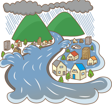
▶洪水ハザードマップを確認しましょう

「外水」とは、堤防の間を流れる河川の水のことです。外水氾濫は、大雨などで水位が増し、堤防の決壊や越流などで大量の水が市街地などに流れ込み、短時間で建物などへ浸水して人的・物的被害を発生させます。近くで大雨が降っていないくても、河川の上流域で大雨が降ると下流の水位が上昇することがあり、注意が必要です。